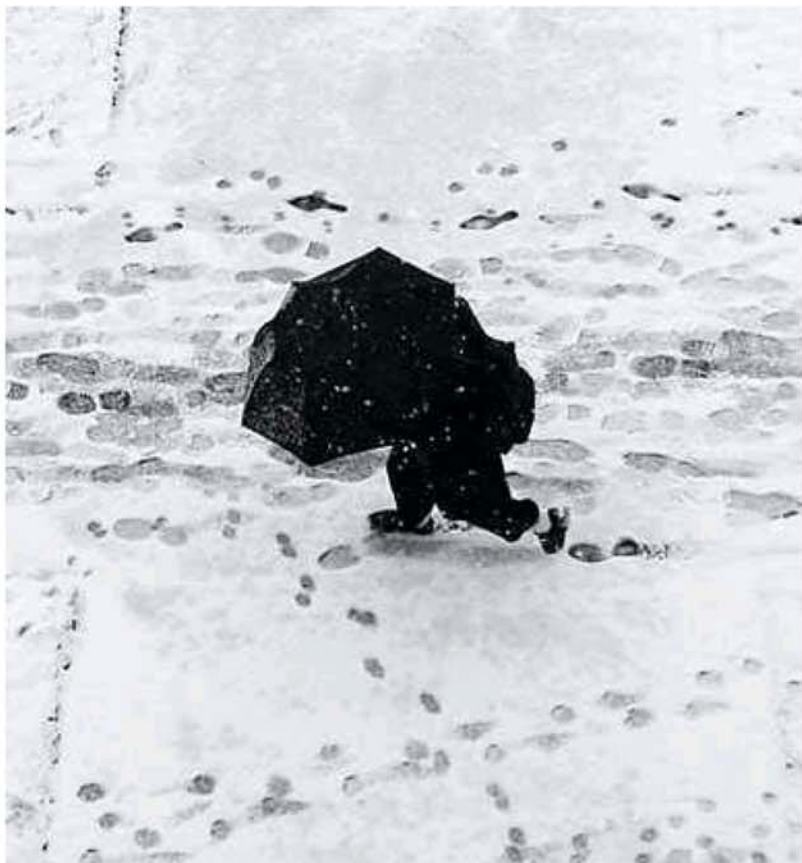
Premières neiges.