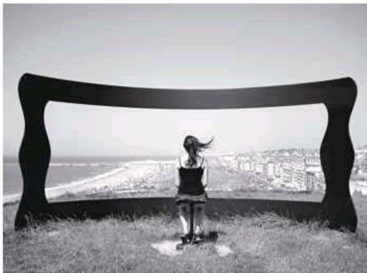
Cadre(s), Dieppe, septembre 2006.