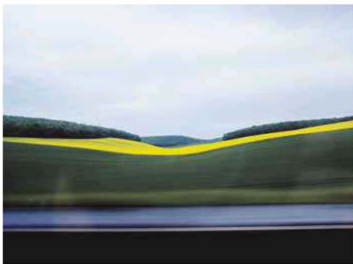
Grande vitesse immobile.