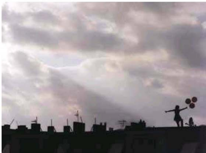
Une fille, trois ballons et des toits, à Berlin.